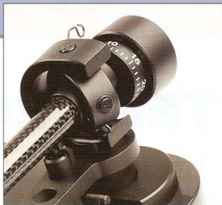
Łożyskowanie Kardana i belka wykonana w całości z włókien węglowych

Estetyka brzmieniowa wyraża się w raczej ciepłym barwowo przekazie. Nie jest to jednak to, z czym kojarzony jest dźwięk pochodzący z pentodowych wzmacniaczy lampowych. Bezpośrednio z tego wynikają zdolności do rekonstrukcji dynamiki i oddania rytmu. RPM5.1 to przedstawiciel grupy gramofonów o sztywnym zawieszeniu, co w połączeniu z niezbyt dużą masą własną (szczególnie talerza) skutkuje pewnymi (niewielkimi, ale słyszalnymi) uproszczeniami w tym względzie. Nie usłyszymy zatem energetyzującego drive'u ani rytmu stymulującego nasze stopy do tupania. Usłyszymy natomiast ładną scenerię i dobre oddanie detali. Z lepszą wkładką, np. sugerowaną przez producenta Salsą Ortofona (MC niskosygnałowa), zyskamy na ogniskowaniu poszczególnych źródeł dźwięku