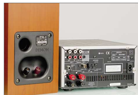
Dbłość o detale widać także z tyłu kolumn. Amplituner jest bogato wyposażony