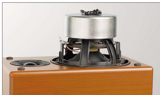
Porządny magnes, wentylacja cewki pod dolnym resorem oraz plastyczne mocowanie magnesu do belki wewnątrz...

W tej materii D-M37 ma zaskakująco wiele do zaoferowania. To już nie zabawka, ale zestaw hi-fi pełną gębą. Zaskakuje precyzją i niskim poziomem podkolorowań. Świetna jakość głośników oraz lepszy zasilacz skutkują mniejszymi niż u rywala zniekształceniami przy głośniejszym grananiu. A trzeba powiedzieć, że Denon potrafi